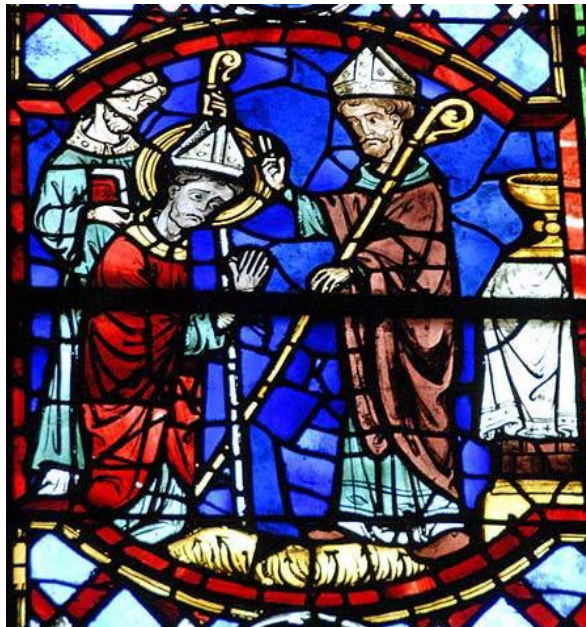
Saint Hilaire sacre Saint Martin, évêque de Tours

Il en va de même désormais pour l'"Église" conciliaire qui, ayant désormais perdu, en 2012, soit 44 ans après la promulgation le 18 juin 1968 de Pontificalis Romani, par la malignité, la passivité ou l'indifférence criminelles de son clergé , la plénitude du VRAI SACERDOCE SACRIFICIEL CATHOLIQUE (Sa "lame" transcendante d'ÉGLISE DU CHRIST) NE PEUT PLUS ATTEINDRE SA FIN SACRIFICIELLE PREMIÈRE, ET NE SAURAIT PLUS PRÉTENDRE APPARTENIR – NI ENCORE MOINS CONSTITUER – EN AUCUNE MANIÈRE LA VÉRITABLE ÉGLISE SACRIFICIELLE CATHOLIQUE FONDÉE PAR NOTRE-SEIGNEUR JÉSUS-CHRIST.