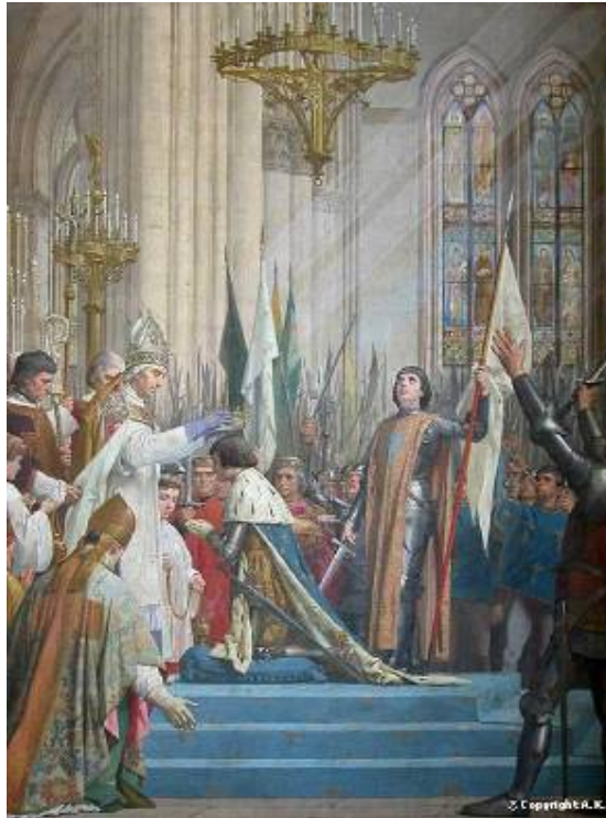
Sainte Jehanne d'Arc à Reims lors du sacre du Roi Charles VII

RESTAURER LE SACRE CATHOLIQUE DES ROIS de FRANCE PRÉSERVER LE SACRE VALIDE DES ÉVÊQUES CATHOLIQUES