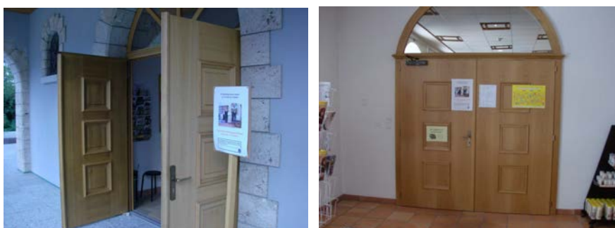
Ici, à l'entrée de l'église d'Ecône, là sur la porte de la chapelle de la crypte

Mais à Ecône, l'objectif était autre. La circonstance était toute trouvée pour, sous couvert d'un rappel sur la tenue dans les églises, profiter de l'affluence de ce jour pour réaliser un grossier matraquage destiné à nourrir, dans le subconscient des fidèles, la vénération indécente envers « Benoît l'apostat », présenté comme le « Vicaire du Christ » (sic !)