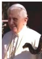
Ratzinger et son plus fidèle compagnon : le serpent !