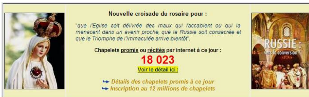
Copie d'écran du site de propagande du District de France – 18 avril 2011

Son texte, comme tous ceux qu'il commet ces dernières années, s'articule autour de deux axes majeurs : afficher une apparente fermeté tout en restant bienveillant envers Benoît XVI (en évitant notamment de le viser ou le dénoncer directement) et persuader les fidèles de la légitimité de celui-ci en développant, de fait, des thèses qui sont en totale contradiction avec le Magistère de l'Eglise.