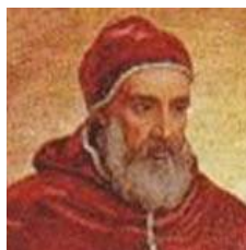
S.S. Paul IV

« § 6. – (...) si jamais il advient qu'un Évêque, même ayant fonction d'Archevêques, de Patriarche ou de Primat ; qu'un Cardinal de l'Église romaine, même Légat, qu'un Souverain Pontife même, avant leur promotion ou leur élévation au Cardinalat ou au Souverain Pontificat, ont dévié de la foi catholique ou sont tombés dans quelque hérésie, la promotion ou l'élévation – même si cette dernière a eu lieu dans l'entente et avec l'assentiment unanime de tous les Cardinaux – est nulle, non avenue, sans valeur ».