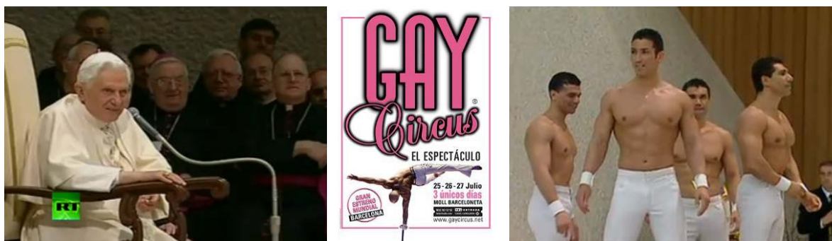
Sourire complice du patron du Vatican à la vue des torses nus et musclés des acrobates pro-gays

« Celui qui scandalisera un de ces petits qui croient en moi, mieux vaudrait pour lui qu'on lui suspende une meule à âne autour du cou et qu'on le précipite au fond de la mer » (Mat. 18, 6).