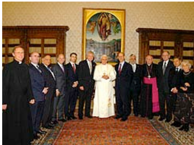
Benoît XVI au milieu d'une délégation du B'naï B'rith International au Vatican en 2006.

En ce temps saint, j'invoque cordialement sur vous et vos familles une abondance de Bénédiction divines. Shalom alechem !