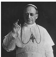
S.S Pie XI

OUI, L'ÉGLISE EST INFAILLIBLE. AUSSI, CEUX QUI REJETTENT SES DÉFINITIONS PERDENT LA FOI ET DEVIENNENT HÉRÉTIQUES ».