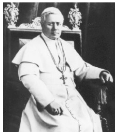
Saint Pie X

L'Église catholique, l'Épouse mystique de Notre Seigneur Jésus-Christ peut-elle perdre la foi ? Que nous dit l'Église à ce sujet ?