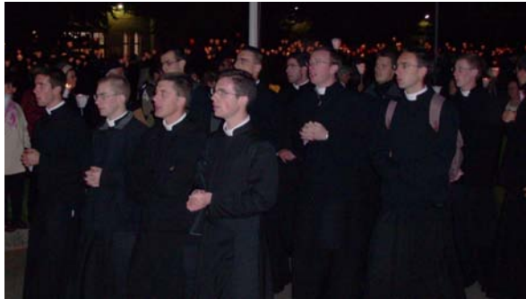
Les séminaristes d'Ecône