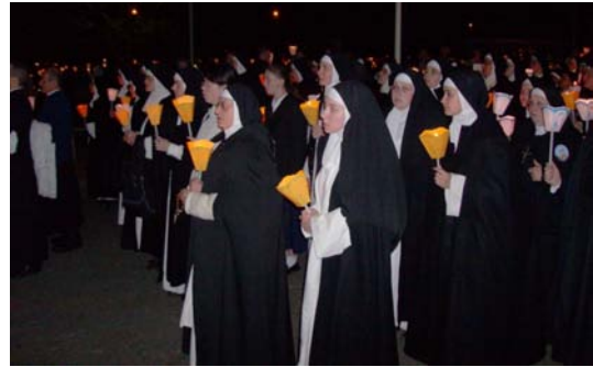
Les dominicaines de Fanjeux

Mais, peu à peu, obnubilée par son souci de respectabilité , la FSSPX s'est refusée à désigner et à considérer les fausses autorités romaines comme des ennemis .