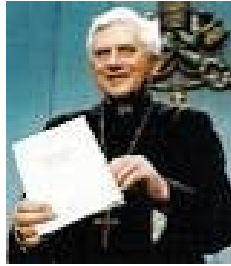
J. Ratzinger, publiant fièrement le faux 3 e secret.

« L'industrie de Fatima, qui doit sa prospérité à son opposition au pape [Jean-Paul II] ne le croira probablement jamais... Jusqu'à présent, nous avons laissé les intégristes suivre leur tragique chemin. En plus de l'appel fondamental à la pénitence, ce que le Vatican a montré d'important est la réfutation de la thèse principale des intégristes : le secret n'a rien à voir avec l'apostasie liée au Concile, au Nouvel Ordo et aux papes conciliaires, comme les intégristes le soutiennent depuis des décennies. Ce seul fait valait la peine de révéler le secret. »