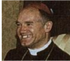
Mgr Fellay fasciné et soumis devant Ratzinger

Regardez la prière de vendredi saint. Une partie de la FSSPX aimerait la dire en obéissance et soumission au Pontife romain. Peut-être qu'une plus grande partie ne veut pas la dire pour une variété de raisons : personnelles/ théologiques/ historiques/ liturgiques /politiques. Il n'y a pas grand-chose que puisse faire le Supérieur général, sinon, à mon opinion ... présider, prier et espérer que le meilleur arrive.